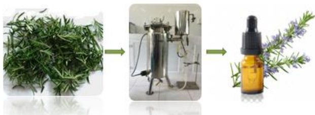
Hình 1 Quy trình chiết xuất tinh dầu hương thảo

Việc chiết xuất tinh dầu từ lá cây Hương thảo được thực hiện bằng cách thủy phân. Nguyên liệu được chuyển vào thùng chứa của thiết bị chưng cất hơi nước, đóng chặt. Tiến hành chưng cất vật liệu đã xử lý trong 3 giờ. Hơi nước và hỗn hợp tinh dầu thu được được tách hoàn toàn thành hai giai đoạn. Lớp tinh dầu trên chảy vào bể để thu gom dầu thô. Nước bên dưới được đưa trở lại phần chưng cất. Tinh dầu sau đó được làm khô với một ít natri sulfat khan. Điều này là cần thiết để làm khô lượng nước trong tinh dầu. Các sản phẩm tinh dầu được chứa trong chai tối, đóng chặt.