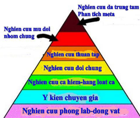
Hình 2. Tháp biểu diễn nghiên cứu – phân tích độ mạnh

Mức độ III: Ý kiến của các cơ quan có thẩm quyền, dựa trên kinh nghiệm lâm sàng, các nghiên cứu mô tả, hoặc các báo cáo của các ủy ban chuyên gia.