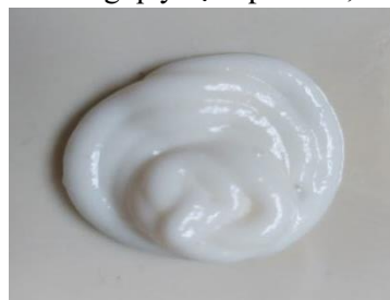
Hình 5 Cảm quan kem đánh răng chứa tinh dầu Quế

Giá trị pH trung bình của kem đánh răng là 7,547. Giá trị này thuộc khoảng quy định pH từ 5,5 đến 10,5.