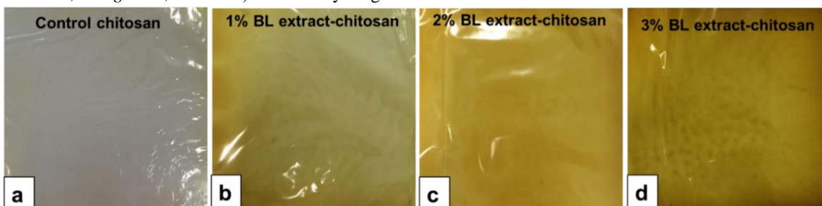
Hình 1 Hình ảnh của màng chitosan (a), chitosan-BL-1% (b), chitosan-BL-2% (c), chitosan-BL-3% (d)

3.1 Sự phân tán của chiết Tràu không trong màng composit Màng chitosan và màng chitosan kết hợp với chiết xuất Tràu không (BL) với những hình ảnh được quan sát trong Hình 1. Ảnh thực của màng chitosan cho thấy màu trắng đục, sáng bóng và không có vết nứt trong khi màng chitosan kết hợp với chiết có màu nâu sáng. Về bề ngoài, màng composit ít sáng hơn khi tăng hàm lượng BL. Màng composit khi kết hợp với 1% và 2% BL xuất hiện khá đồng nhất và không có nếp nhăn trong khi màng với 3% BL quan sát thấy nhiều nếp nhăn và bọt khí. Theo kết quả phân tích SEM, bề mặt màng trở nên xù xì khi tăng hàm lượng BL từ 1% đến 3%. Tuy nhiên, bề mặt màng đồng nhất và không có khuyết tật lớn với nồng độ BL thấp hơn 3%. Điều này chứng tỏ có sự tương hợp tốt giữa mạch chitosan và BL ở hàm lượng BL thấp hơn 3%. Tuy nhiên, khi kết hợp với hàm lượng BL cao hơn 3%, sự hình thành nhiều lỗ hồng lớn có thể là do sự bay hơi của những hợp chất và các dung môi trong quá trình sấy khô với sự kết tụ các thành phần chiết[11].