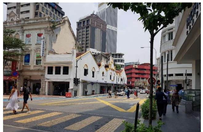
Hình 3 Đường phố quanh khu chợ trung tâm Kuala Lumpur

Có thể nói, nền văn hóa của Kuala Lumpur là sự tổng hợp và pha trộn giữa những nền văn hóa khác nhau du nhập vào (Ấn Độ, Trung Hoa, Hồi giáo, phương Tây) và người Mã Lai bản địa. Ở những nơi khác trên thế giới, việc có quá nhiều các phong cách và văn hóa khác nhau sẽ gây bất lợi cho việc quản lí của chính quyền và khó tạo nên sự đồng nhất về qui hoạch và kiến trúc cho địa phương đó. Nếu quản lí và định hướng không khéo có thể dẫn đến sự xung đột và bất ổn trong đời sống xã hội. Đây là một thách thức không nhỏ trong bài toán phát triển đối với bất cứ quốc gia nào. Tuy nhiên, ở Malaysia, các tôn giáo và văn hóa khác nhau kể trên vẫn được tôn trọng và tồn tại song song chung với quốc giáo là Hồi giáo. Nhiều nền văn hóa cộng hưởng dẫn đến các công trình kiến trúc có hình thái rất phong phú và đa dạng. Chính phủ Malaysia với những chính sách của mình đã giữ cho sự đa dạng văn hóa và kiến trúc này trở thành đặc trưng văn hóa của họ.