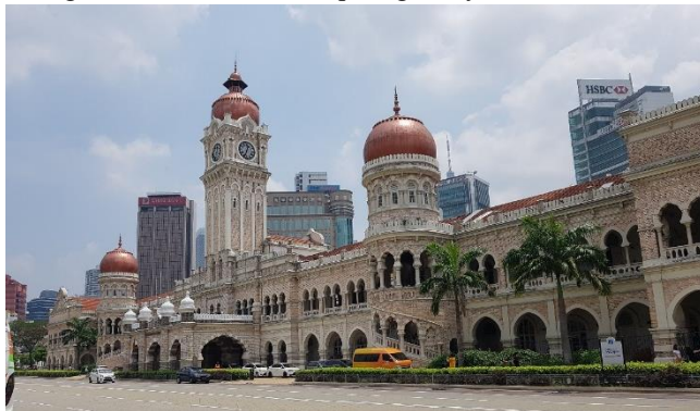
Hình 2 Tòa nhà dinh toàn quyền Anh ở quảng trường Merdeka, Kuala Lumpur

Ngược dòng lịch sử, sự thuận lợi về hàng hải và vị trí địa lý chiến lược đã có những ảnh hưởng mạnh mẽ, xuyên suốt đối với lịch sử hình thành của Malaysia. Văn hóa Ấn Độ giáo, Phật giáo và Hồi giáo theo con đường giao thương đã đặt ảnh hưởng đến quốc gia này từ rất sớm. Hồi giáo đến Malaysia ngay từ thế kỷ thứ 10, thiết lập nền tảng vững chắc ở thế kỷ thứ 14 và 15, kéo theo việc thành lập một loạt các vương quốc Hồi giáo, nổi bật nhất là Malacca. Đến nay, Hồi giáo đã trở thành quốc giáo của liên bang Malaysia và ảnh hưởng sâu rộng đến mọi mặt của đời sống người dân. Ngoài ra, trong chiều dài lịch sử của mình, việc từng là thuộc địa của Bồ Đào Nha, Hà Lan, Anh cũng ảnh hưởng không nhỏ đến văn hóa của quốc gia này[1].