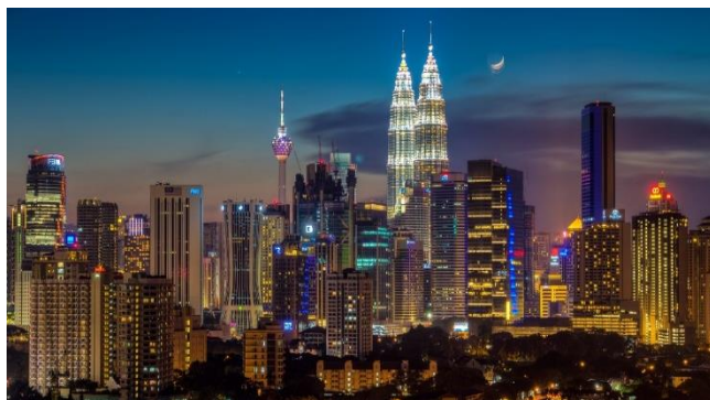
Hình 10 Tháp đôi Petronas và thành phố Kuala Lumpur về đêm.