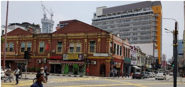
Hình 4 Đường phố quanh khu chợ trung tâm Kuala Lumpur

Mình họa trên là hình ảnh của một khu phố ở Kuala Lumpur với đủ các dấu ấn của các nền văn hóa khác nhau. Mọi người có thể nhận thấy các chi tiết trang trí Hồi giáo đặc trưng hiện diện ở tòa nhà màu trắng (góc phải) và ở tòa nhà cao tầng hiện đại (phía xa), các dãy nhà phố kiểu gờ chỉ và vòm cột phương Tây (góc trái), công trình nhà phố màu trắng viền vàng mang hơi hướng Ấn Độ (hình giữa). Đi sâu hơn về phía trong chúng ta có thể dễ dàng bắt gặp các công trình mang dáng dấp kiểu người Hoa và người bản địa Mã Lai. Tất cả các công trình này đều đứng cạnh nhau một cách tự nhiên.