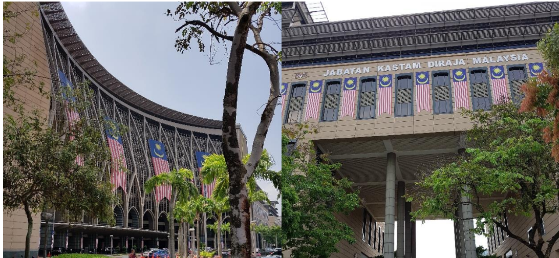
Hình 7 Các quốc kì trên mặt đứng công trình ở thủ đô hành chính Putrajaya

khắp mọi nơi và mọi lúc với nhiều hình thức khác nhau. Trên những xa lộ của thành phố Kuala Lumpur, các lá cờ luôn treo đều tăm tắp. Trong các con phố nhỏ hơn, những khu phố cũ, chung cư hay trung tâm thương mại, cửa hàng... đâu đâu cũng thấy những lá cờ phấp phới. Người Malaysia còn sử dụng chúng như một thành phần trang trí quan trọng cho mặt đứng kiến trúc.