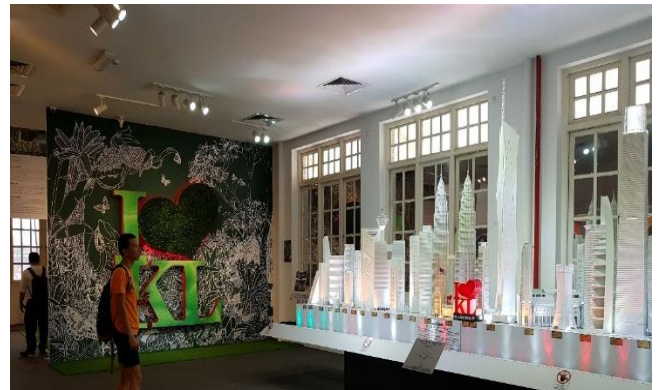
Hình 8 Mô hình các công trình cao tầng đã và đang xây dựng được trưng bày ở Nhà trưng bày thành phố.

Ở Kuala Lumpur, mọi dự án xây mới đều được minh bạch và triển lãm ở Phòng trưng bày của thành phố. Sự lắng nghe của chính quyền đối với ý kiến của người dân và các chuyên gia đã làm cho các công trình cao tầng xây dựng sau này ở Kuala Lumpur đều thống nhất về tư tưởng và không phá vỡ không gian đô thị cũ.