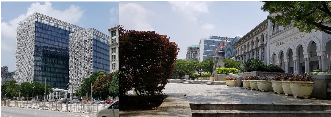
Hình 6 Các công trình xây mới ở thủ đô hành chính Putrajaya

Các chi tiết kiến trúc Hồi giáo, đặc biệt là các họa tiết (hoa văn, chi tiết trang trí kiến trúc, kiểu bố cục tổ hợp mặt đứng công trình...) cứ xuất hiện hết dưới dạng này đến dạng khác và đi vào tâm trí chúng ta một cách từ từ. Chúng xuất hiện ở các công trình xây mới, đường xá (chi tiết gạch lát vỉa hè, biển báo tên đường, gạch ốp lát bồn hoa...) bên cạnh các công trình cũ đã tồn tại lâu đời. Sự định hướng của chính phủ khiến cho những công trình cao tầng xây mới chiếm những vị trí rất tốt trong đô thị. Việc định hướng góc nhìn và vẻ ngoài của chúng khiến người dân cảm nhận được rõ rệt về sự hiện diện của văn hóa Hồi giáo và sự liên kết chặt chẽ với quá khứ. Ở Hình 5, chúng ta có thể thấy công trình cao tầng xây mới này nhìn rất ra “chất Malaysia”, với sự xuất hiện của những họa tiết Hồi giáo theo phương ngang. Cách tạo hình và khối tích của nó đã trở thành một điểm nhấn tốt cho đô thị.