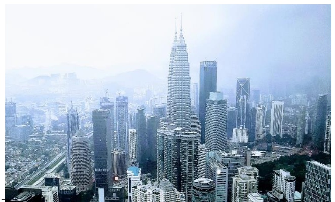
Hình 11 Hình chụp Kuala Lumpur từ tháp truyền thông Menara