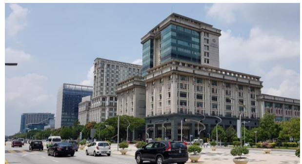
Hình 1 Cảnh quan đường phố của thủ đô hành chính Putrajaya.

Vào tháng 10 năm 2018, nhận lời mời từ Trường Đại học Tunku Abdul Rahman, đoàn giảng viên khoa Kiến trúc-Xây dựng-Mĩ thuật Ứng dụng của Trường Đại học Nguyễn Tất Thành đã tham quan và giao lưu với trường bạn tại thủ đô Kuala Lumpur. Chuyến đi đã mang lại nhiều thành công vượt mong đợi trên phương diện hợp tác giữa hai trường. Thêm vào đó, những ngày thăm Malaysia còn đem lại nhiều cảm xúc thật sự mới mẻ và đầy hứng thú về sự phát triển của quốc gia này. Trong số đó, các đặc trưng văn hóa và các công trình kiến trúc ở Kuala Lumpur gây ấn tượng mạnh mẽ nhất.