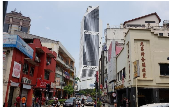
Hình 5 Công trình cao tầng Landmark ở Kuala Lumpur

bản nhạc thì văn hóa Hồi giáo chính là giai điệu chính, và các văn hóa khác xuất hiện như những nốt biến tấu khiến bản nhạc trở nên hấp dẫn.